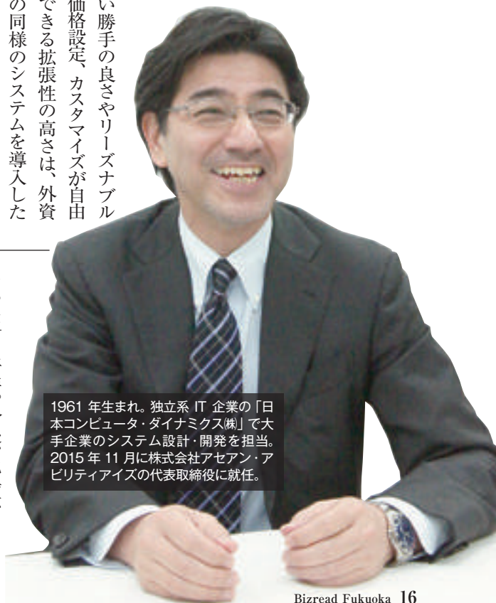
1961年生まれ。独立系IT企業の「日本コンピュータ・ダイナミクス(株)」で大手企業のシステム設計・開発を担当。2015年11月に株式会社アセアン・アビリティアイズの代表取締役就任。

使い勝手の良さやリーズナブルな価格設定、カスタマイズが自由にできる拡張性の高さは、外資系の同様のシステムを導入した企業からも高く評価されて、システムを移行した例も増えている。ヴィーナス・クラウドの導入に際しては、月額9800円(3ユーザ)のトライアル版もあり、手軽に採用できる点も好評だ。 不動産業界版も開発、ビジネスショウに出展 ヴィーナス・クラウドのカスタマイズを図り、アセアン・アビリティアイズが、福一不動産様向けに開発したのが『5カウントシステム』だ。「自社に最適な不動産営業の仕組みづくりができる」「営業活動が数値化されてグラフで表示されるので、ひと目で会社の状況が分かるように